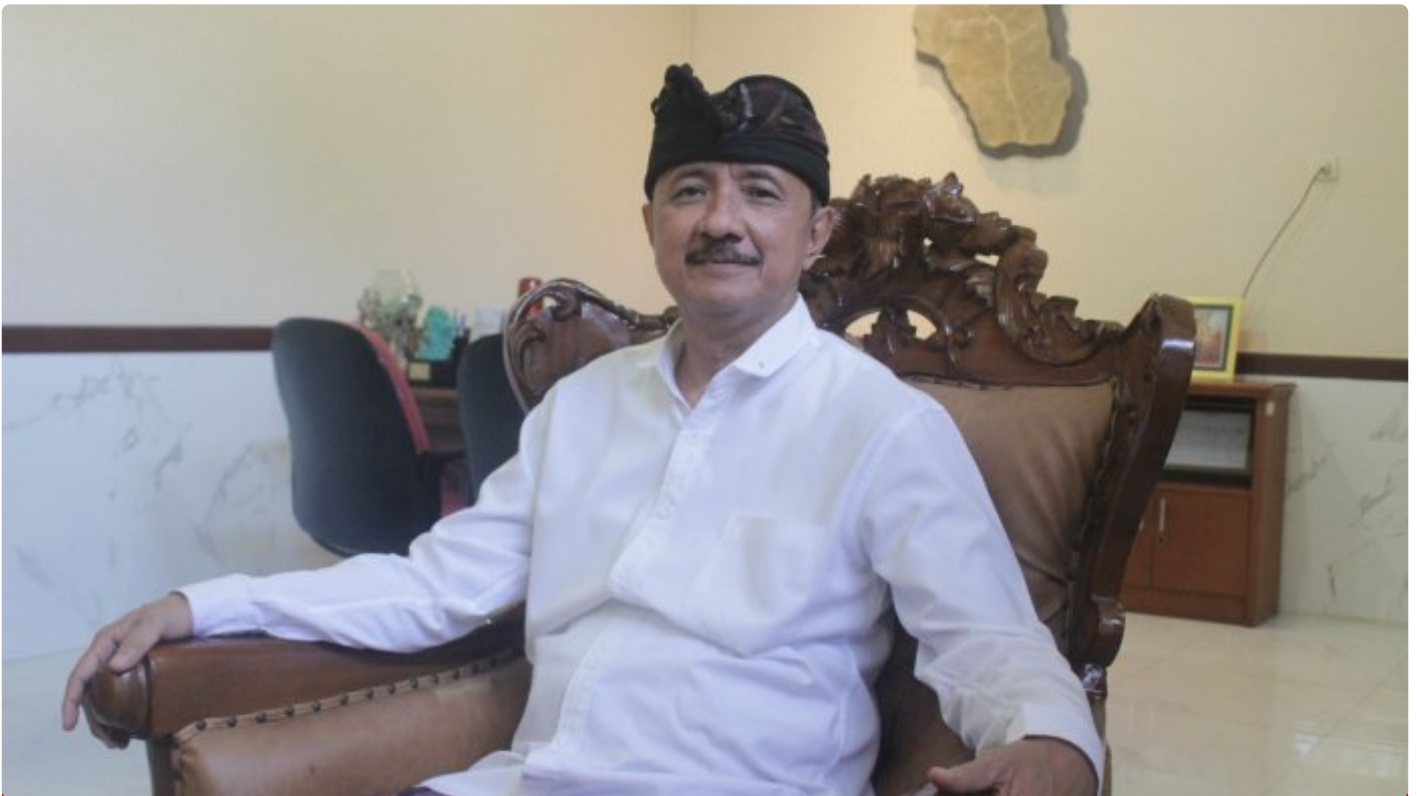
Tjok Bagus Pemayun, Kepala Dinas Pariwisata Provinsi Bali.

Oleh; Tjok Bagus Pemayun, Kepala Dinas Pariwisata Provinsi Bali